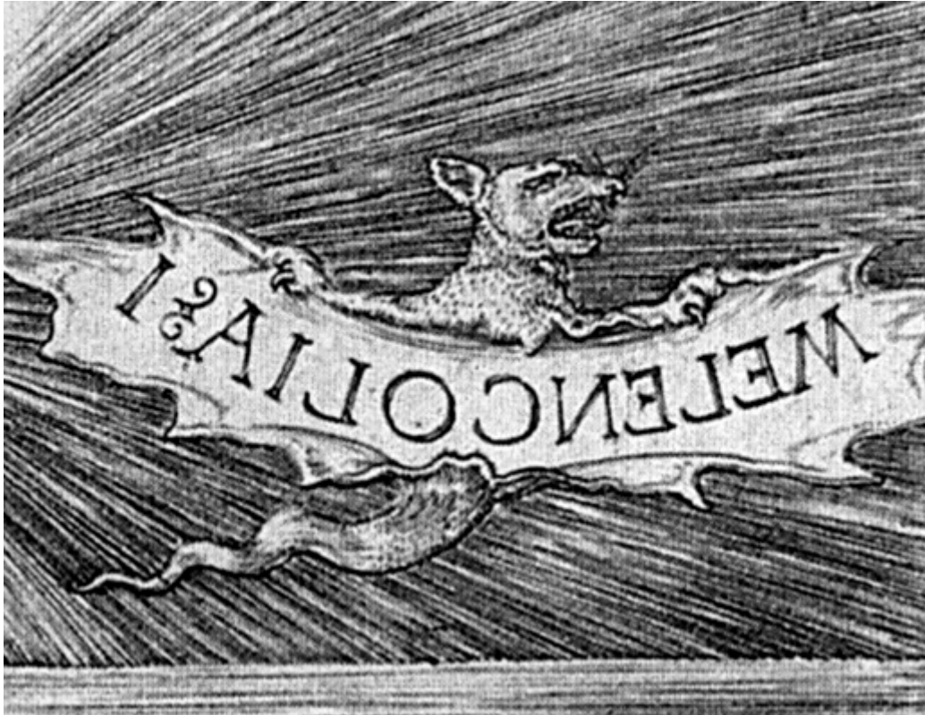
Spiegelbild des Titels

Um das Thema anderer möglicher Fehler des Kupferstechers Dürer abzuschließen, sei die berüchtigte Eins – „1“ in der Aufschrift „MELENCOLIA I“ erwähnt. Es ist nicht vollkommen auszuschließen, dass dies überhaupt keine „1“ und auch nicht der Buchstabe „i“ ist, sondern der erste Strich des Buchstabens „M“, den Dürer irrtümlich anstelle des Schrägstrichs des korrekten Buchstabens „A“ begonnen hatte einzustechen. Dem Meister war klar, dass ihm ein Fehler unterlaufen war, aber es war nicht mehr möglich, diesen zu korrigieren, wie im Falle der Sechs auf dem magischen Quadrat (und der Neun unter der Sechs, die der Meister anfänglich in nicht umgekehrter Form eingestochen hatte, so wie sie auch auf den ersten Abdrücken der „MELENCOLIA I“ – beispielsweise auf einem Blatt aus der Otto Schäfer- Sammlung erhalten geblieben ist).